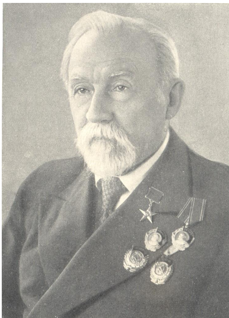
Рис. 1. Д.Н. Прянишников