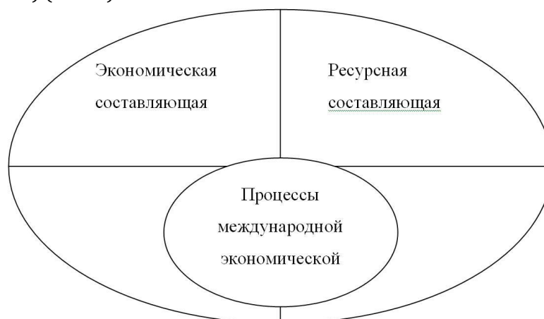
Рис. 1. Процессы международной экономической интеграции [составлено коллективом авторов]